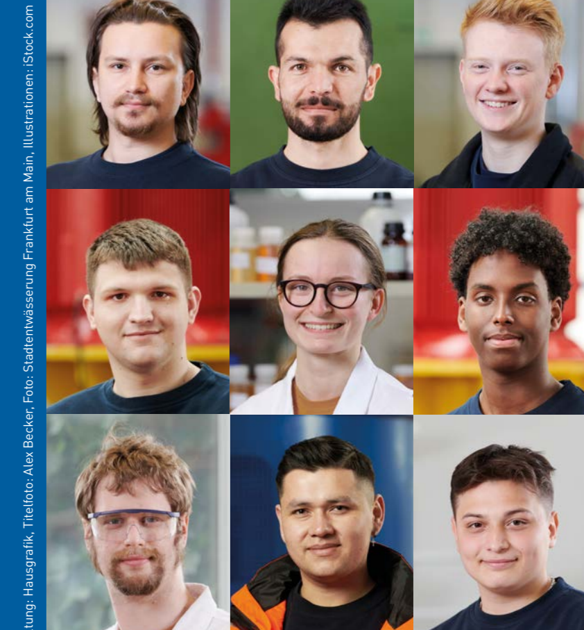
Redaktion: Jani Kitz, Gestaltung: Hausgrafik, Illustrationen: iStock.com